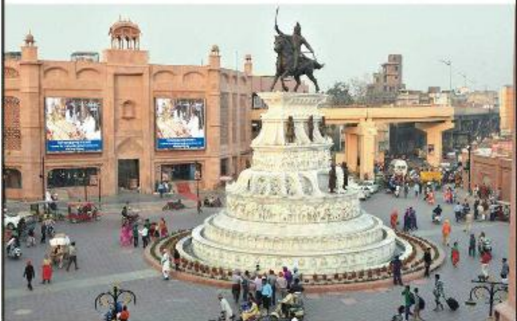
ਸ੍ਰੀ ਦਰਬਾਰ ਨੂੰ ਆਉਂਦੇ ਰਸਤੇ ਦੇ ਸੁੰਦਰੀਕਰਨ ਤਹਿਤ ਲਗਾਇਆ ਗਿਆ ਸ਼ੇਰੇ ਪੰਜਾਬ ਮਹਾਰਾਜਾ ਚਣੀਤ ਸਿੰਘ ਦਾ ਬੁੱਤ।